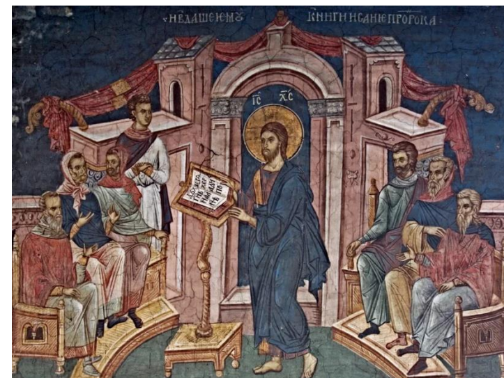
Le Christ à la synagogue de Nazareth Monastère serbe de Visoki

D'après une homélie du pape Benoît XVI – 27 janvier 2013