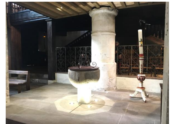
église St Vincent à Ciboure

Splendeur de la gloire du Père, Lumière de toute lumière, Tu es la clarté de ce jour nouveau. Soleil qui resplendit sans fin, envoie sur nous tes rayons, Répands en nos cœurs l'Esprit Saint. Et toi, Père de Jésus Christ, Père très bon, très glorieux, Viens soutenir notre marche, Dirige nos volontés vers toi, Secours-nous dans la rude montée, Rends-nous forts dans la foi. Que ta Parole soit notre pain, Que ta Sagesse soit notre joie, Que ton Amour soit notre vie. Dès l'aurore, à midi et le soir, Fais-nous servir sous ton regard, Tes fils qui sont nos frères. Amen