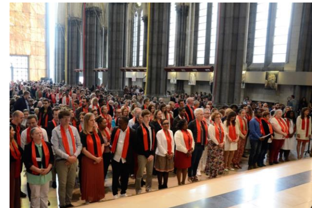
Pentecôte 2019 – Cathédrale de la Treille à Lille Confirmation de plus de 180 adultes et jeunes qui, comme les Apôtres à la Pentecôte, ont accueilli cette force de l'Esprit Saint pour mieux grandir dans la foi et être des témoins de l'amour de Dieu.

Seigneur, notre Dieu, dans les éclairs et le feu, sur la montagne du Sinaï, tu as donné à Moïse l'ancienne loi, et dans le feu de l'Esprit, au jour de la Pentecôte, tu as révélé l'Alliance nouvelle : accorde-nous de toujours brûler de cet Esprit que tu as répandu mystérieusement sur tes Apôtres, et donne à l'Israël nouveau, rassemblé de toutes les nations, d'accueillir avec joie l'éternel commandement de ton amour.