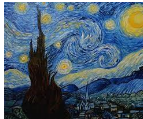
Van Gogh, La nuit étoilée

2. Tu nous as dit qu'il faut Te suivre, Tu nous as dit qu'il faut chanter L'amour de Dieu qui nous délivre Et puis vivre en ressuscités