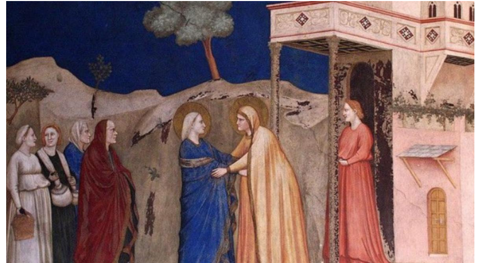
"La Visitation de Marie à Elisabeth" - Giotto Basilique de Saint-François à Assise.

Extrait d'un discours du Pape Benoît XVI pour la fête de la Visitation en 2006