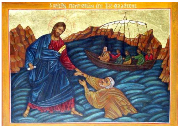
Marche de Jésus sur l'eau