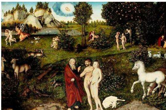
Adam et Eve dans le jardin d'Eden, Lucas Cranach l'ancien