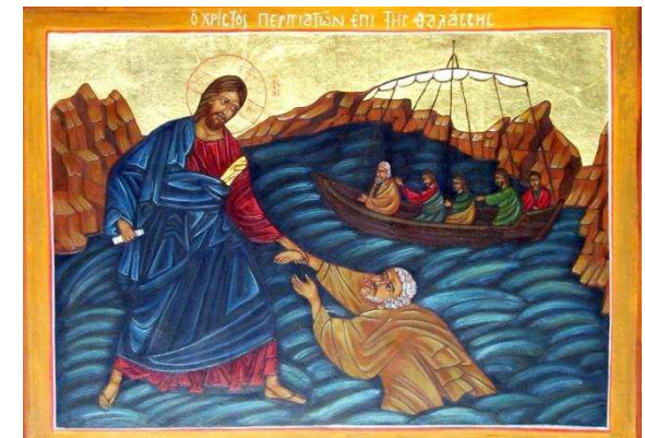
Marche de Jésus sur l'eau - http://www.soborna.org

En toi j'ai mis ma confiance, Ô Dieu très Saint, Toi seul es mon espérance et mon soutien. C'est pourquoi je ne crains rien, J'ai foi en Toi ô Dieu, très Saint. C'est pourquoi je ne crains rien. J'ai foi en Toi ô Dieu, très Saint.