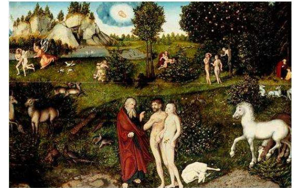
Adam et Eve dans le jardin d'Eden, Lucas Cranach l'ancien