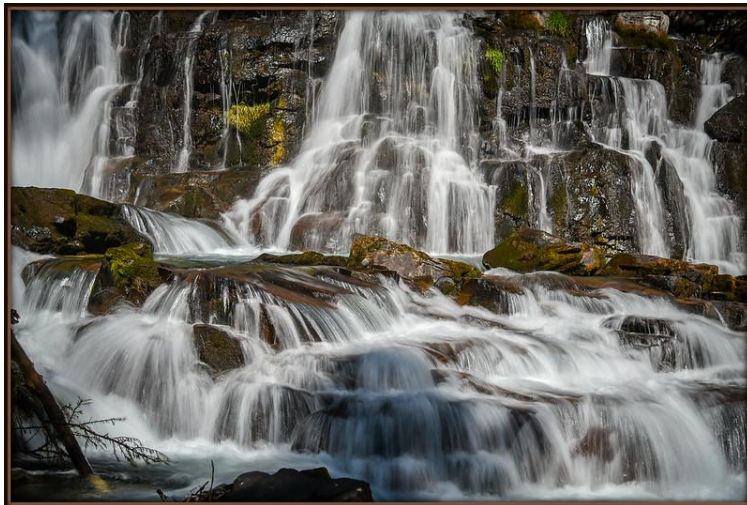
Immersion en eau vive

« L'heure vient » exprime l'idée que le changement est là : la source extérieure du puits profond du Patriarche a été remplacée par une source intérieure qui s'ouvre sur un culte nouveau, intime, parce qu'il est l'œuvre de l'Esprit.