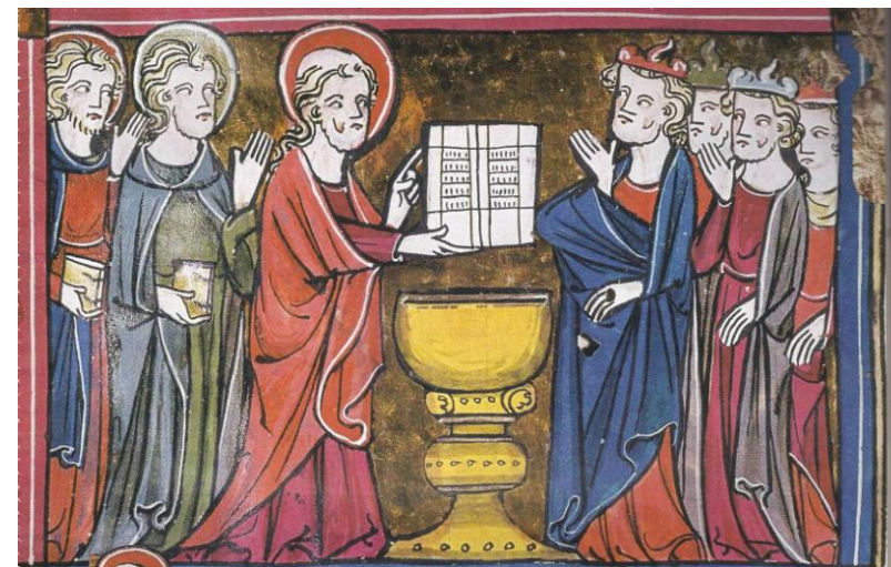
Saint Paul, suivi de deux compagnons, remet un livre aux Corinthiens au-dessus des fonts baptismaux, 14 ème s., Bibliothèque Ste Geneviève, Paris

Le Christ, en effet, ne m'a pas envoyé pour baptiser, mais pour annoncer l'Évangile, et cela sans avoir recours au langage de la sagesse humaine, ce qui rendrait vaine la croix du Christ.