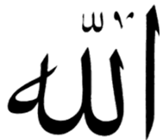
Dieu [Allah en arabe]

Au nom de Dieu, le Tout miséricorde, le Miséricordieux Louange à Dieu, Seigneur des univers Le Tout miséricorde, Le Miséricordieux le roi du Jour de l'allégeance. C'est Toi que nous adorons, Toi de qui le secours implorons Guide-nous sur la voie de rectitude la voie de ceux que Tu as gratifiés, non pas celle des réprouvés, non plus que de ceux qui s'égarerent