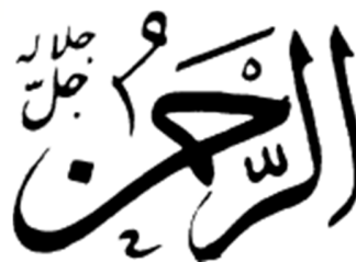
Le Très-Miséricordieux [Ar-Rahman]

« Dis Ô Mes serviteurs qui avaient commis des excès à votre détriment, ne désespérez pas de la miséricorde de Dieu. Dieu en vérité pardonne tous les péchés. Oui, c'est lui le tout pardonnant, le tout miséricordieux » (Coran 39/53-59).