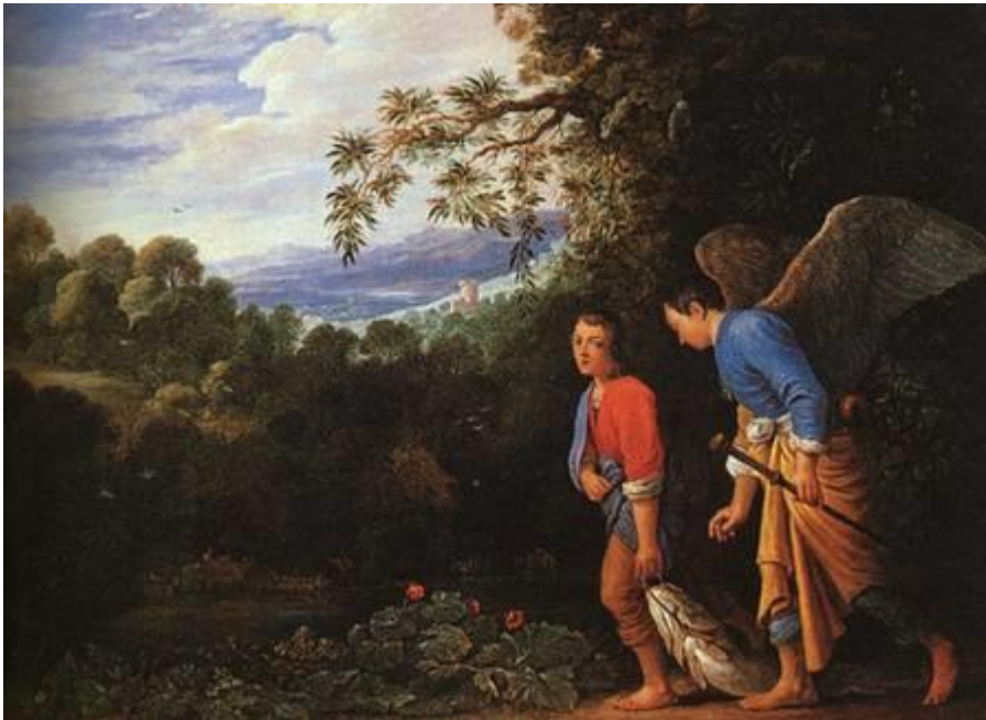
Tobie et l'Ange - Copie par les disciples d'Adam Esheilmer, 1625 Site chretiensaujourd'hui.com