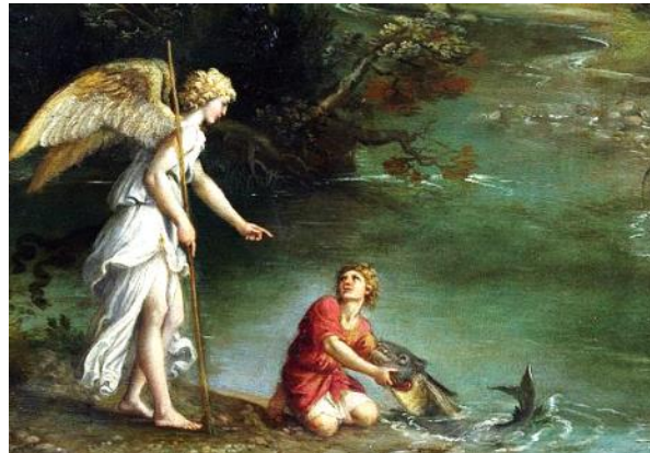
Le Dominiquin – L'archange Raphaël avec Tobie – Extrait - vers 1610-13

Cahier Evangile 101, Le livre de Tobit ou le secret du Roi , p.38