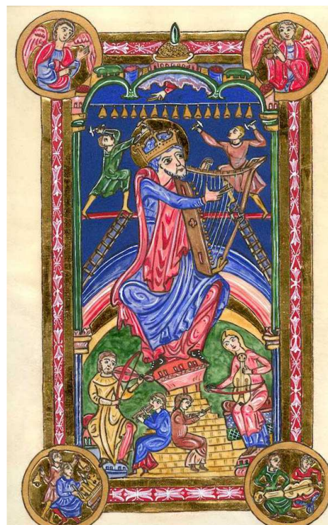
Miniature sur parchemin Roi David, Psautier d'York