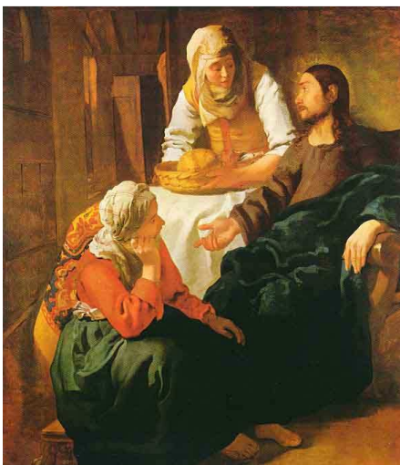
Le Christ dans la maison de Marthe et Marie Jan Vermeer van Delft, 1654-55

38 Or, comme ils étaient en route, il entra dans un village et une femme du nom de Marthe le reçut dans sa maison. 39 Elle avait une sœur nommée Marie qui, s'étant assise aux pieds du Seigneur, écoutait sa parole. 40 Marthe s'affairait à un service compliqué. Elle survint et dit : « Seigneur, cela ne te fait rien que ma sœur m'ait laissée seule à faire le service ? Dis-lui donc de m'aider. » 41 Le Seigneur lui répondit : « Marthe, Marthe, tu t'inquiètes et t'agites pour bien des choses. 42 Une seule est nécessaire. C'est bien Marie qui a choisi la meilleure part ; elle ne lui sera pas enlevée. »