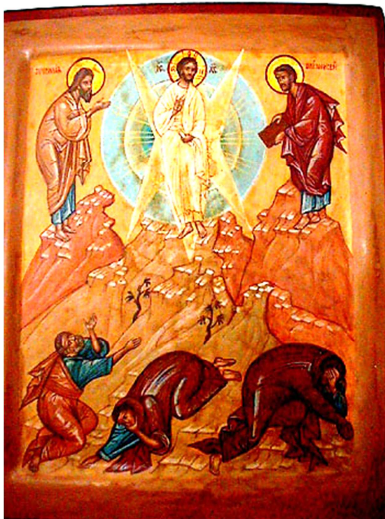
Monastère Orthodoxe Notre Dame de Toute Protection

Comme il parlait encore, voici qu'une nuée lumineuse les recouvrit. Et voici que, de la nuée, une voix disait : « Celui-ci est mon Fils bien-aimé, celui qu'il m'a plu de choisir. Ecoutez-le ! »