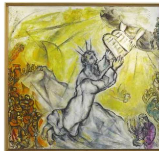
Marc Chagall, Moïse recevant les Tables de la Loi (1960-1966)