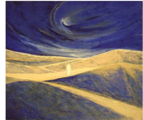
Peinture de MACHA CHMAKOFF

1 - Seigneur, avec toi nous irons au désert, Poussés comme toi par l'Esprit, Et nous mangerons la Parole de Dieu, Et nous choisirons notre Dieu, Et nous fêterons notre Pâque au désert : Nous vivrons le désert avec toi.