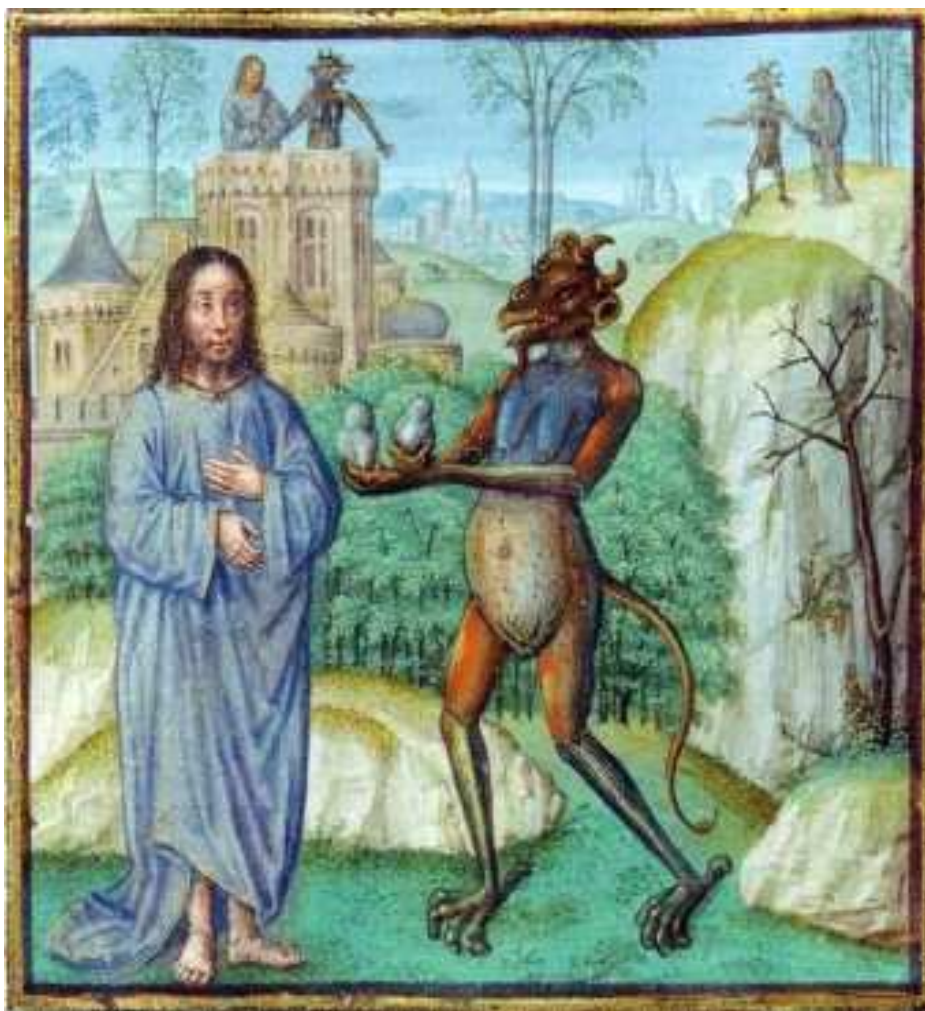
La tentation de Jésus au désert, Miroir de l'humaine condition, Ecole française, XV e siècle

« Si tu es le Fils de Dieu, ordonne que ces pierres deviennent des pains. »