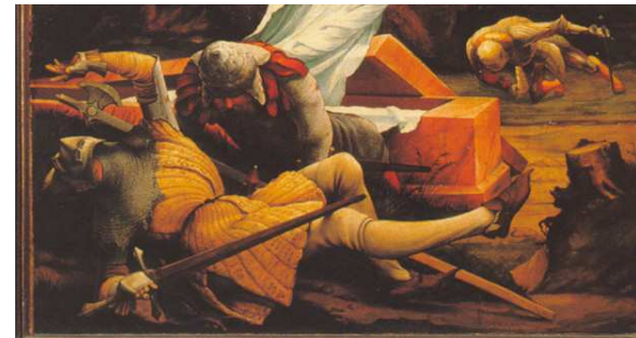
Lorenzo Veneziano - 1370

Comme la réplique inversée de la mort de Jésus, sa résurrection provoque à son tour d'étranges phénomènes : la terre tremble, les tombeaux s'ouvrent, des soldats défontent. L'ange du Seigneur qui avait tant guidé Joseph, Marie et leur petit (Mt 1-2) réapparaît maintenant dans tout son éclat. Comme déjà en ces débuts d'Évangile, où l'ange déroutait les uns pour mettre les autres sur d'autres chemins, à nouveau son apparition dérouté les gardes qui s'échappent dans l'inconscience et replace les femmes sur les routes de la promesse.