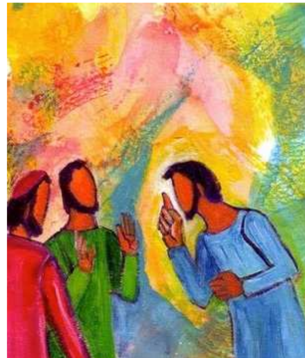
B. Lopez - site Evangile et peinture