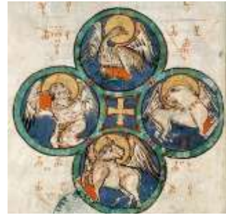
Evangélaire du XIème siècle*

« En lui était la vie, et la vie était la lumière des hommes » Jn 1,4