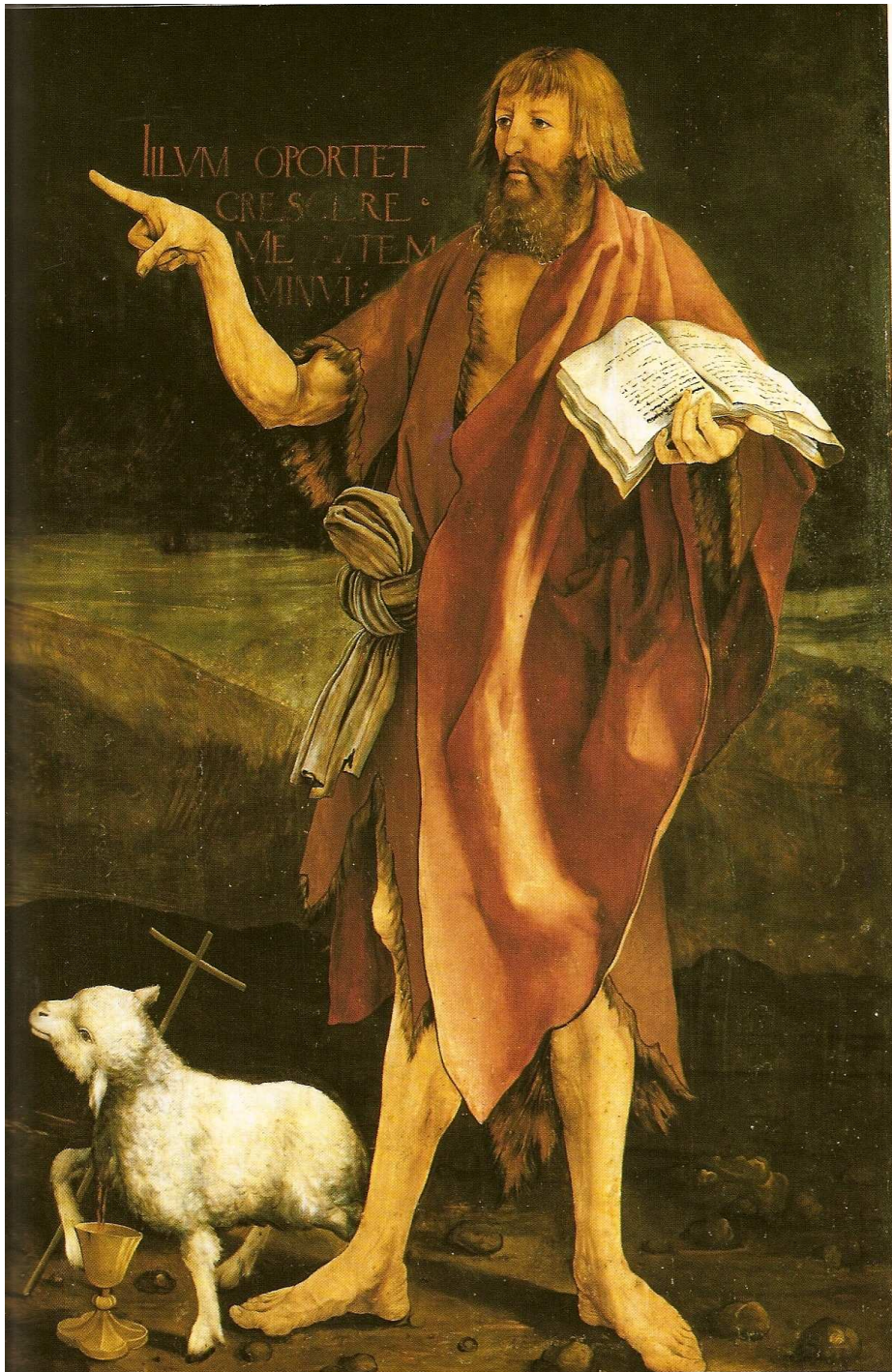
Jean-Baptiste dans « La Crucifixion » détail du retable d'Issenheim de Matthias Grünewald, ( 1512-1516) musée d'Unterlinden de Colmar

« Telle est ma joie, elle est parfaite. Il faut qu'il grandisse et que moi, je diminue » Jn 3,29-30