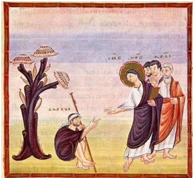
Evangélaire d'Egbert 10ème siècle